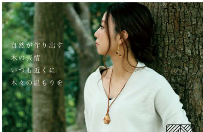
寄木細工によるアクセサリや文房具