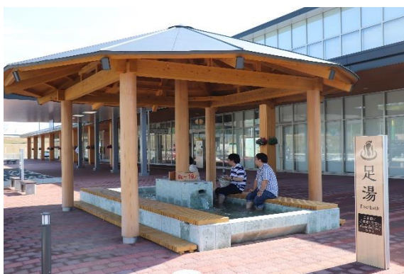
天然温泉を使用した足湯