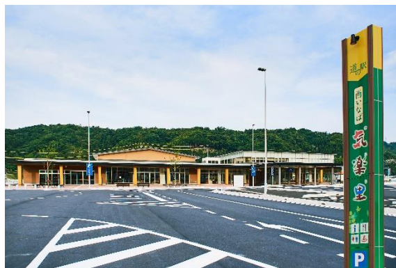
道の駅西いなば気楽里 外観

■問合せ 道の駅西いなば気楽里 電話 0857-82-3178 URL http://nishinaba.jp/