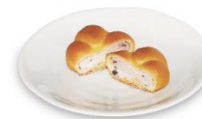
因幡万葉の梅・花詩集

「令和」・「万葉集」関連商品の詳細は、鳥取県庁食のみやこ推進課ホームページに掲載しています。URL https://www.pref.tottori.lg.jp/284682.htm