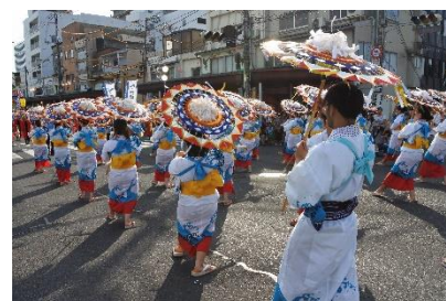
鳥取しゃんしゃん祭 一斉踊り