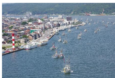
みなと祭 水上パレード