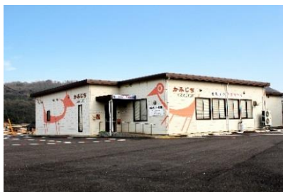
青谷上寺地遺跡展示館

また、伝統工芸品である「因州和紙」の展示見学や紙漉き体験ができる「あおや和紙工房」もあり、この地ならではの歴史や文化を知ることができます。