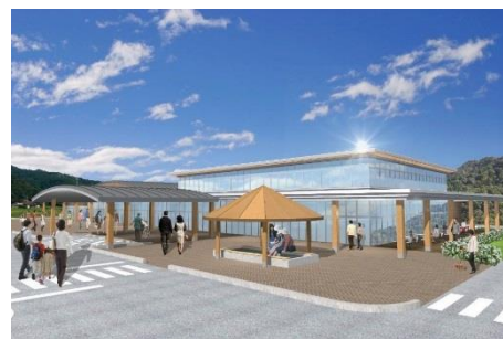
道の駅 完成イメージ