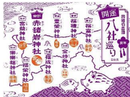
亥年 開運手ぬぐい

URL https://www.tottori-guide.jp/kaiun8/