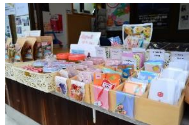
売店で扱うお守りや特産品