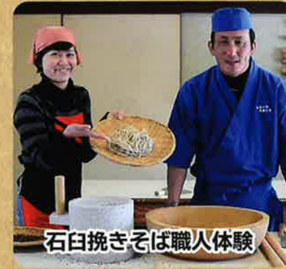
石臼挽きそば職人体験

昔ながらの臼(うす)と杵(きね)でもちつきを体験します。小さく丸めて、ぜんざいなど色々なお餅の食べ方を試してみてください。