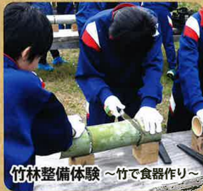
竹林整備体験 ~竹で食器作り~

竹を割り、節を取り下準備します。傾斜を付けながら竹を組み合わせて長〜い竹の樋(とい)を作り茹でたソーメンを流して食べます。