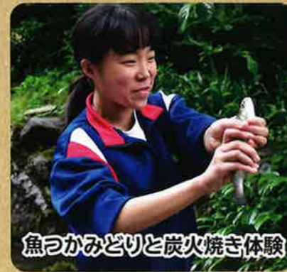
魚つかみどりと炭火焼き体験

清流で育った川魚(ニジマス)をため池でつかみどります。自分で捕まえた魚を調理して、炭火焼きにさせていただきます。