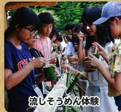
流しそうめん体験

わさび農家の仕事を体験します。収穫まで2年かかる棚田は訪れた人の心を癒してくれるはず。本物のわさびをぜひ味わって下さい。