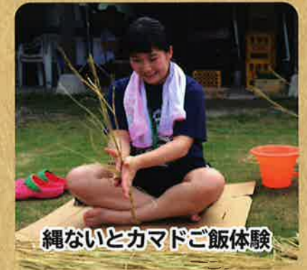
縄ないとカマドご飯体験

大山の雪解け水で育った蕎麦を、石臼で挽いてそばを打つ体験ができます。職さんが丁寧に教えてくれるので、初めてでも大丈夫！