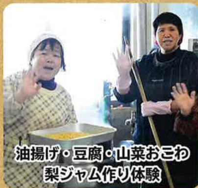
油揚げ・豆腐・山菜おこわ 梨ジャム作り体験

農家のお母さんに教わる田舎料理体験。畑の肉と言われる栄養豊富な大豆や、山菜、梨など(関金産)一度食べたら忘れられない味です。