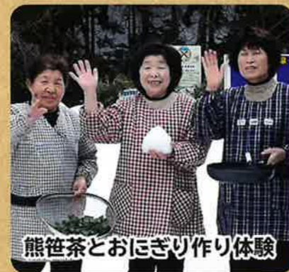
熊笹茶とおにぎり作り体験

牛のエサやり、ブラッシングなど牛飼いの仕事を体験します。運が良ければ仔牛の出産に立ち会えるかも知れません！