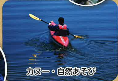
カヌー・自然あそび