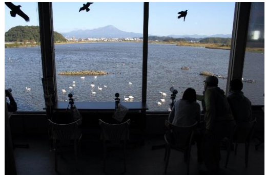
ネイチャーセンターから見た景色