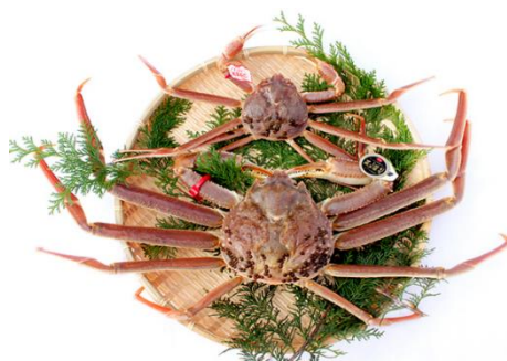
特選とっとり松葉がに「五輝星」

五輝星は、大きさ、重さ、形状、色合い、身いりの厳しい5つの基準をクリアした最上級の松葉がにのトップブランドで、非常に希少な松葉がにです。