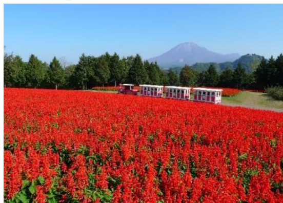
とっとり花回廊のサルビアと大山

そんな「次なる発展への出立の地」赤猪岩神社から日本最大級のフラワーパーク「とっとり花回廊」へ歩くコースは、途中、グリーンパーク大山ゴルフ倶楽部前から大山と日本海の素晴らしい眺望を楽しむことができます。ゴール地点の花回廊では、豚汁のふるまいがあります。