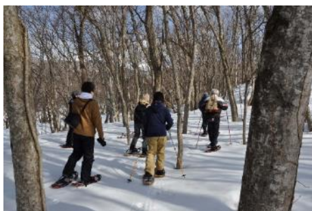
冬のスノーシューガイド

奥大山ガイドクルーが渓流の自然や歴史をわかりやすく案内します。五感を目覚めさせるワークの体験や奥大山の水で入れた格別のコーヒーも賞味でき、ガイドしか知らないオススメの写真スポットも教えてもらえるかも？！