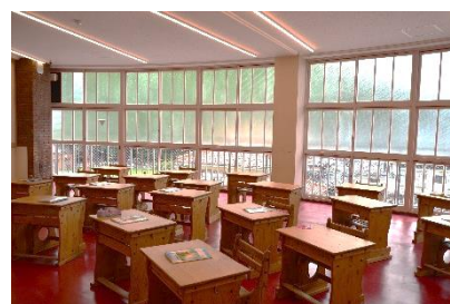
当時の教室を再現