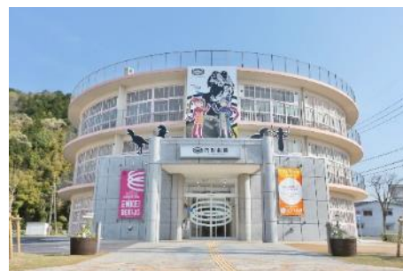
円形校舎・旧明倫小学校を活用

1950年代に多数建築された円形校舎のうち現存する最古のもので、中央のらせん階段や扇形の教室など独特の特徴を活かした空間は一見の価値があります。