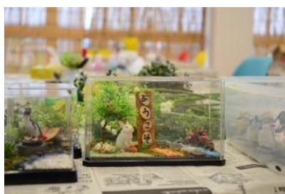
動物ジオラマ作り体験