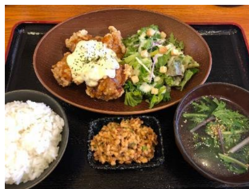
ランチミールクーポン 昼食一例

■クーポン・チケットの問合せ (一社) 倉吉観光マイルス協会 電話 0858-24-5371