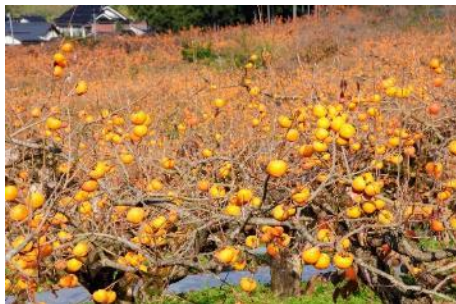
花御所柿畑（八頭町）

URL https://www.pref.tottori.lg.jp/178202.htm