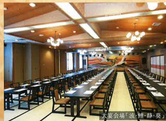
宴会会場「波・鯉・静・葵」