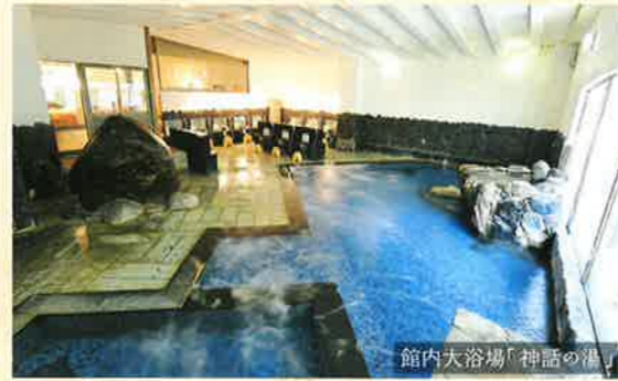
館内大浴場「神話の湯」