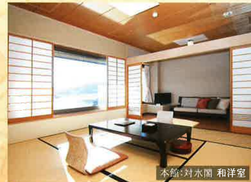
本館:対水閣 和洋室