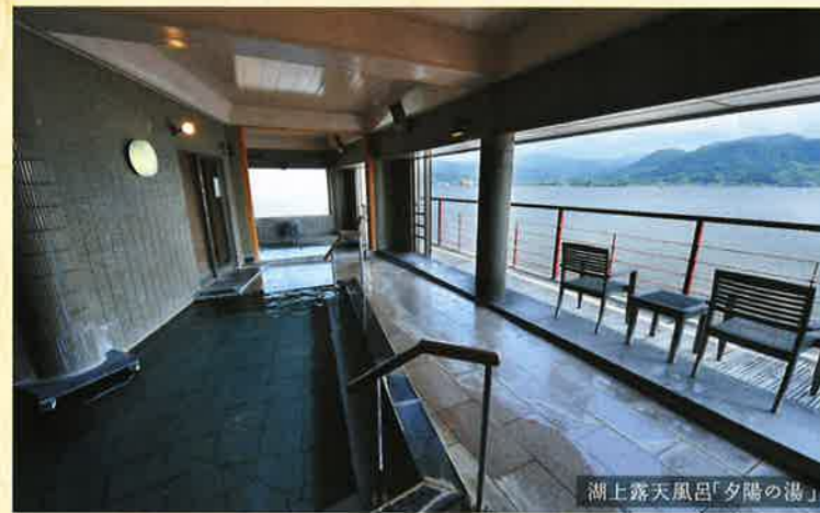
湖上露天風呂「夕陽の湯」