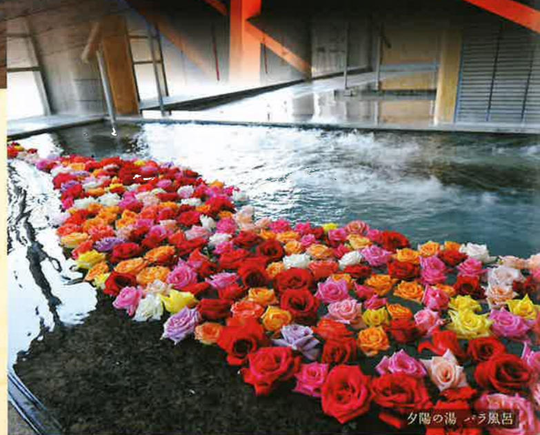
夕陽の湯 露天風呂