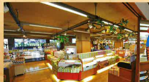
お土産処:ふるさと