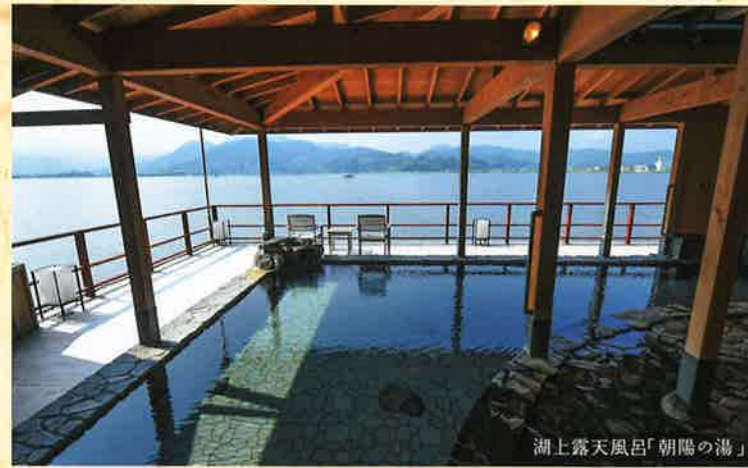
湖上露天風呂「朝陽の湯」