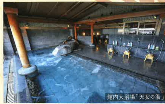
館内大浴場「天女の湯」