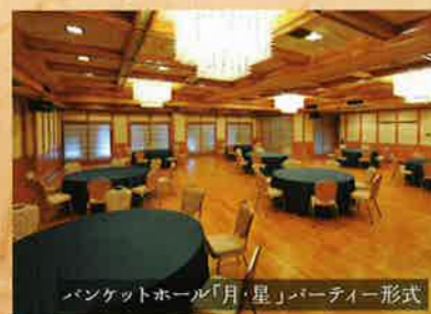
バンケットホール「月・星」パーティー形式