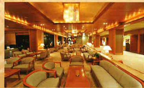
ティーラウンジ:湖水の舞