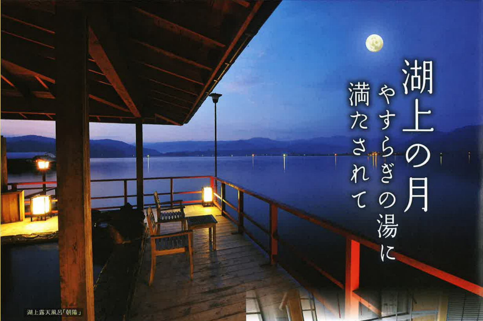
湖上露天風呂「朝陽」