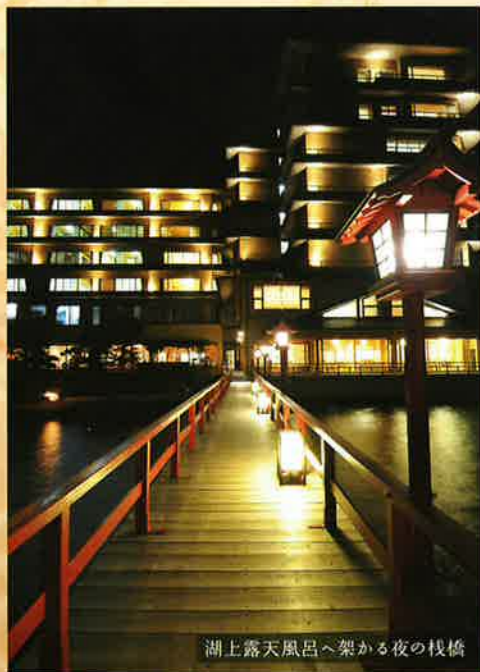
湖上露天風呂へ架かる夜の棧橋

湖上へといざなう棧橋「湯めぐり湖道」。望湖楼が誇る、日本唯一の湖上露天風呂へと繋がる道です。刻々と変わる東郷湖の景色をごゆっくりお楽しみいただけます。