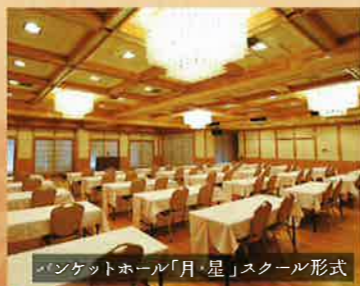
バンケットホール「月・星」スクール形式