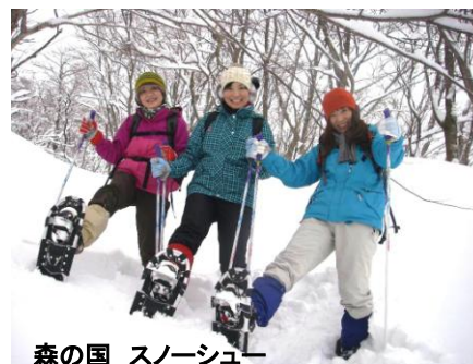
森の国 スノーシュー

■問合せ先／森の国(西伯郡大山町赤松 634) 電話 0859-53-8036 ホームページ http://www.japro.com/morinokuni/