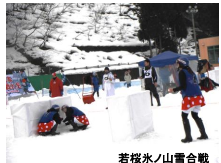
若桜氷ノ山雪合戦

毎年2月に西日本雪合戦大会が行われ、県内外から多くの参加者が熱い戦いを繰り広げます。一般の部の優勝者は、北海道で開催される国際雪合戦大会への切符を手に入れることができます。雪合戦の勝敗は、相手のフラッグを取るか、敵チームに多く雪玉を当てるかで決まります。また強いチームだけの戦いだけでなく、コスチューム賞やフラッグ賞などいろいろな賞があり、楽しんで戦うチーム合戦でもあります。新たなスポーツにチャレンジしてみたい方はいかがでしょう。