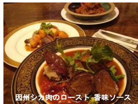
因州シカ肉のロースト 香味ソース

ホームページ http://www.inabagibier.jp/index.html