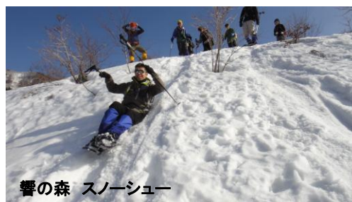
響の森 スノーシュー

冬季ならではの雪遊び体験は、スノーシューハイクやスキートレッキング、大人の遠足など楽しみ方は沢山あります。スノーシューハイクは雪の中を走っており「下り」がおもしろく、また、シートを敷いて滑るとスピード感が増したりと、童心に帰ったように楽しさも倍増します。雪上フィールドゲームなどで、子どもや大人も雪まみれの体験をしませんか。