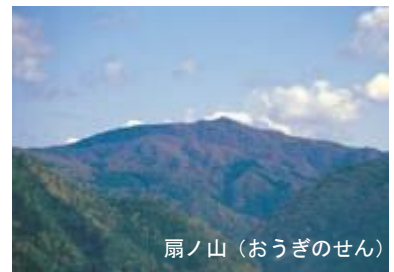
扇ノ山(おうぎのせん)

扇ノ山は標高が1,310メートル、兵庫県との県境に位置し、南方の氷ノ山と連なり、東の大山とは又趣の異なる優美な山容を見せています。東部では、氷ノ山、那岐山とともに、四季に応じた登山の対象として親しまれています。鳥取市内から望むたおやかな扇形の山嶺には鳥取県側、兵庫県側からいくつもの登山ルートが開かれています。雨滝地内から河合谷林道を経由し、「水とのふれあい広場」を起点とする「河合谷ルート」は標高差が300メートルもなく、ブナやコナラの木立の中を緩やかに登ってゆく快適なコースで、最もポピュラーといえましょう。移動はマイカー利用がおすすめです。鳥取市内からは県道31号線を国府町方向に向かい、雨滝地内を抜け、河合谷林道に入ります。河合谷牧場を過ぎたあたりに「水とのふれあい広場」があり、駐車スペースもあります。林道を50メートルほど進んだ脇に登山口道標があり、登山の開始です。一般的には5月～11月頃が登山適期ですが、木々の緑が濃い夏、また紅葉の秋がベストシーズンですね。道は広く、迷うことなく頂上に導かれます。頂上手前の展望台からは市街地が一望でき、頂上には2階建ての避難小屋もあります。(トイレなし)下山後、水場に湧き出る水でのどを潤せば、疲れも一気に解消されるでしょう。帰りには、日本の滝百選にも選ばれた名瀑「雨滝」への立ち寄りもおすすめです。