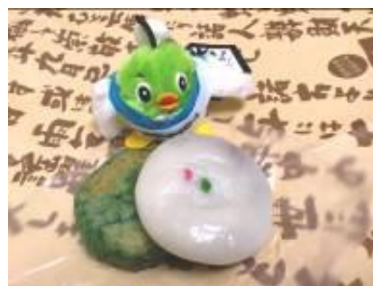
写真左：おやき、右：弁天まんじゅう

江嶋弁天ゆかりの「弁天まんじゅう」は、米粉を使った生地なので、もちりして、餡も甘さ控えめ。まんじゅうの表面には「鶴・亀・桜」の三種類の押し型がされ、「鶴」は家内安全、「亀」は円満長寿、「桜」は商売繁昌を表しています。表面に付いている「赤」と「緑」の点は、縁結びの願をこめてつけられた縁起の良い印なのだとか……。