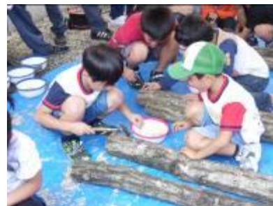
とっとりきのこまつり「植菌体験」