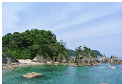
東浜海水浴場西側、西脇海岸を望む

◆鳥取県立山陰海岸学習館：山陰海岸の魅力を、さまざまな資料や映像で紹介する施設で、砂や生き物などを学習観察することも出来ます。無料で観られる 3D 映像「大地と海の物語」は、山陰海岸の魅力がぎゅっと詰まった映像です。映像の美しさだけでなく、波や魚が目の前に迫る臨場感は、まるで水中ダイバーと一緒に海を泳いでいるようです。