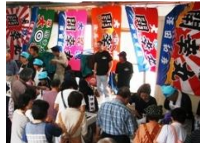
浦富定置網土曜朝市

岩美町浦富地区（県漁協浦富支所）では、定置網漁業により、アジやアゴ（トビウオ）、白イカなどを水揚げしていただきます。日本海の魚介類が、お買い得価格で購入できます！当日の朝は、何が並ぶかお楽しみ。