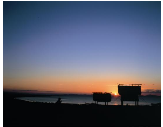
むきぱんだ史跡公園から夕陽を眺める

ホームページ http://www.pref.tottori.lg.jp/mukibanda/