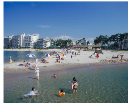
皆生温泉海水浴場

○夜の皆生温泉で「皆生温泉ちびっこ広場」開催！当てクジコーナー、紙芝居、大抽選会、乗馬体験、ミニ花火が催されます。夏の思い出がまたひとつ増えますね！