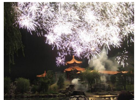
燕趙園内での花火大会

■問合せ先／中国庭園燕趙園 TEL 0858-32-2180 ホームページ http://www.encho-en.com/