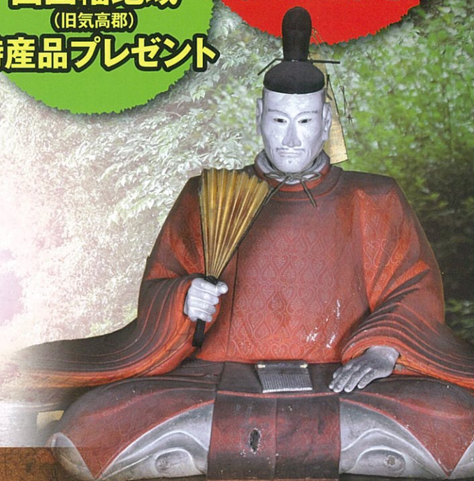
亀井茲矩公木像 津和野永明寺所蔵

※ハーフコース、フルコースとも同額(保険加入、お茶代) ※参加料は当日受付でお支払いください。