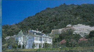
仁風閣／鳥取城跡にある旧鳥取藩主池田家のフレンチルネッサンス様式の別邸。