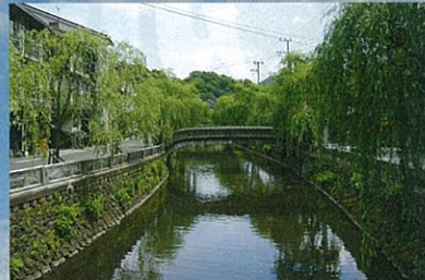
城崎温泉／しっとりとした風情を数々の文豪が愛した歴史ある温泉地。