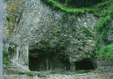
玄武洞／山陰ジオパーク兵庫県豊岡市にある約160万年前の噴火による玄武岩石柱大露頭。