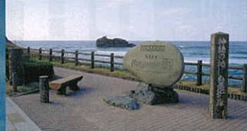
白兔海岸／山陰ジオパークの最西端にある神話「因幡の白兔」の舞台となる地。