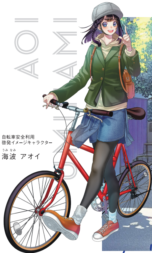
自転車安全利用 啓発イメージキャラクター うみなみ 海波 アオイ