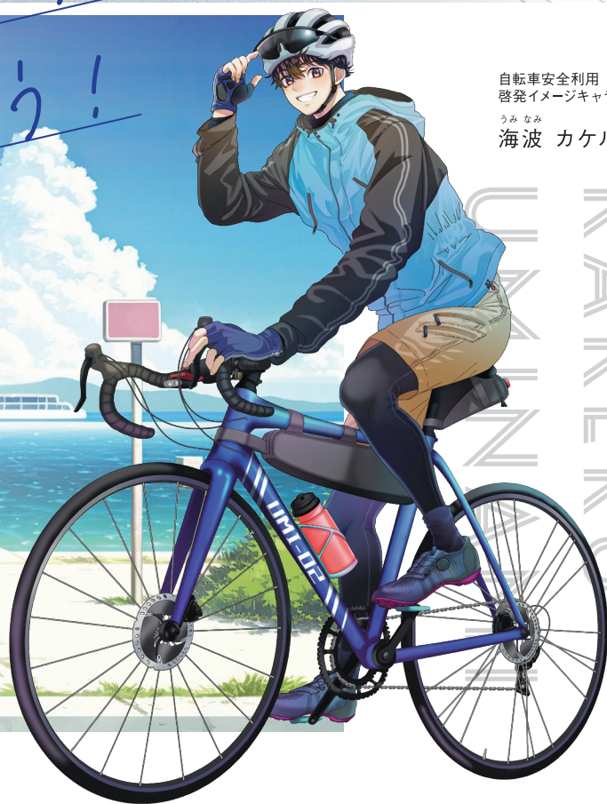
自転車安全利用 啓発イメージキャラクター うみなみ 海波 カケル