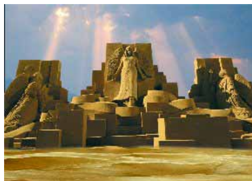
「砂の美術館 - 第3期展示 - 」イメージ

「砂の美術館」は日本で唯一「砂」を素材にした彫刻作品を展示する野外美術館です。昨年開催した第2期展示では、約8カ月の開催期間中に延べ32万人の入館者を記録しました。また、今年4月18日から5月31日までの間、「2009鳥取・因幡の祭典」のオープニングイベントとして開催された「世界砂像フェスティバル」には、約1ヶ月半の期間中に35万人もの入場者が全国各地から訪れました。「世界砂像フェスティバル」が大盛況に終わり、その熱が冷めならぬ今年の秋、「砂の美術館 - 第3期展示 - 」を下記内容で開催します。