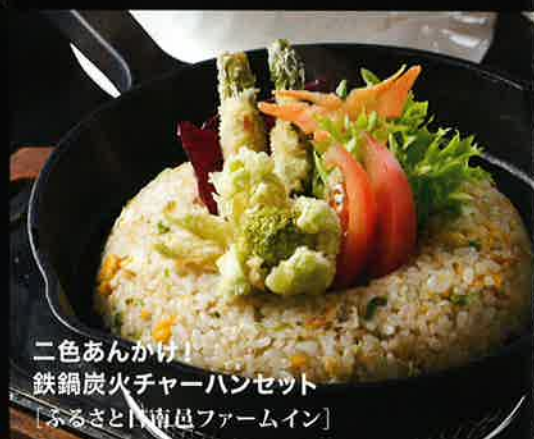
二色あんかけ 鉄鍋炭火チャーハンセット [ふるさと|直島ファームイン]

豊かな森林、水、土によって古くから 良質の鉄を産した日野郡。 製鉄の匠たちが熟練の技で炎を操り、 質の高い玉鋼を生産。 「たたらんち」は、 日野郡産の美味しい素材から生まれた 季節の味と彩りに満ちた カラダ喜ぶ鉄鍋料理。