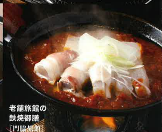
老舗旅館の 鉄焼御膳 [門脇旅館]