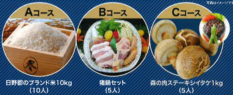
Aコース 日野郡のブランド米10kg (10人)