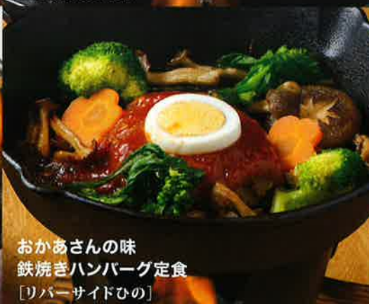
おかあさんの味 鉄焼きハンバーグ定食 [リバーサイドひの]