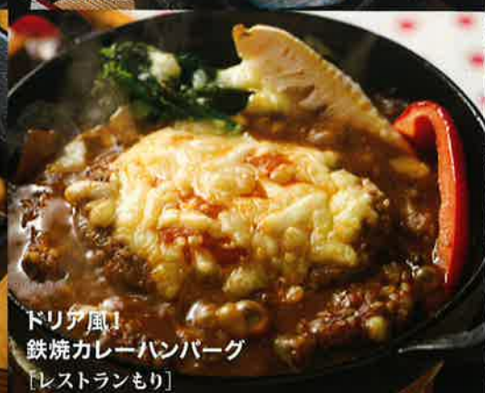
ドリテ風! 鉄焼カレーハンバーグ [レストランもり]