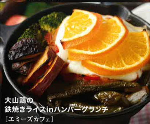
大山鶏の 鉄焼きライスinハンバーグランチ [エミーズカフェ]