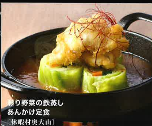
彩り野菜の鉄蒸し あんかけ定食 [休暇村奥大山]