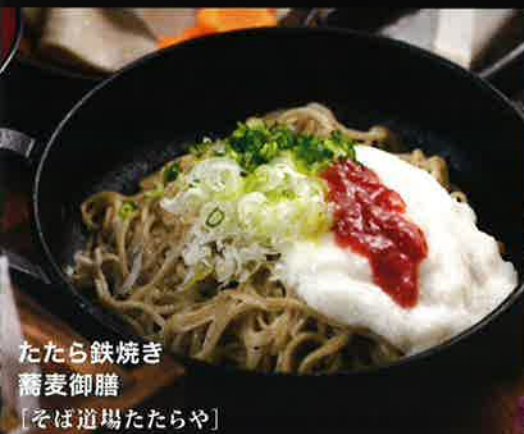
たたら鉄焼き 蕎麦御膳 [そば道場たたらや]