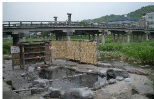
三朝温泉「河原風呂」